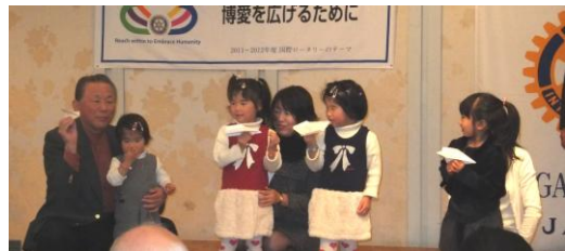
ジジがお手本ですよ~ よく見てね(〇)