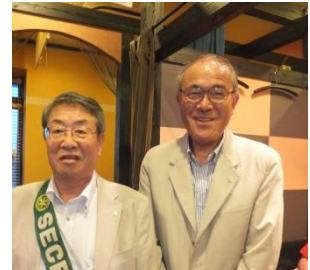
バッチとタスキの引き継ぎ