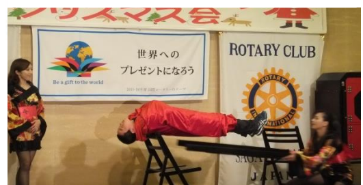
ヒェへ(◎◎)/どがんで浮いと〜つ? (空中浮遊)